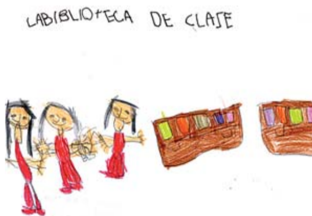
2. Valeria Gracia Komurkova, 5 años, 3º de Educación Infantil del CEIP Aragón de Alagón (Zaragoza).