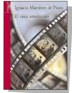
'El viaje americano'. Ignacio Martínez de Pisón. Alfaguara. Serie Roja. Desde los 14 años.